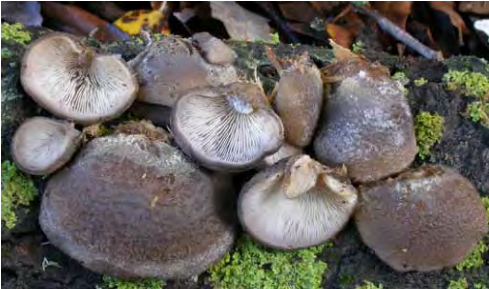
Hohenbuehelia mastrucata (Fr.) Singer (JCS-600B).