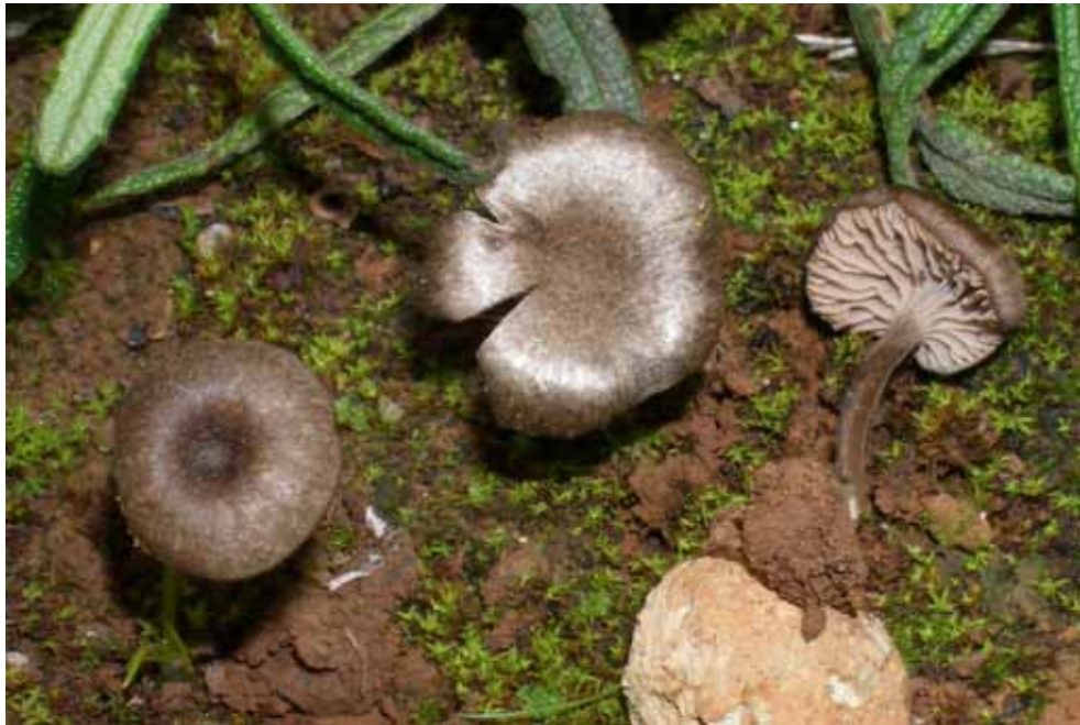
Entoloma phaeocyathus Noordel. (JCS-637B).