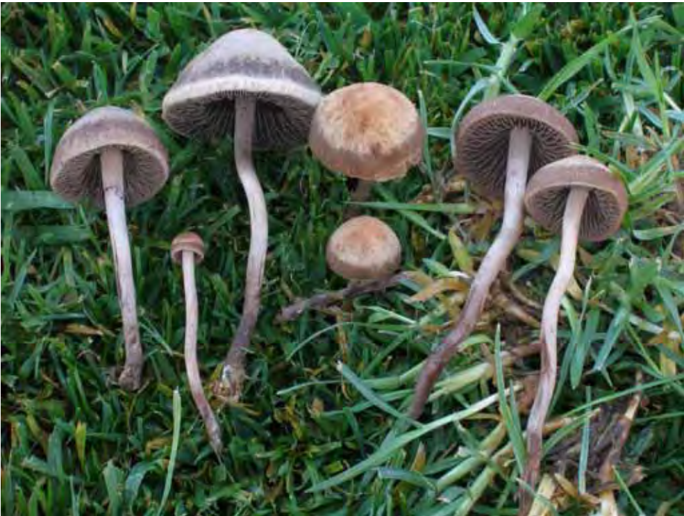
Panaeolus cinctulus (Bolton) Britzelm. (JCS-698B).