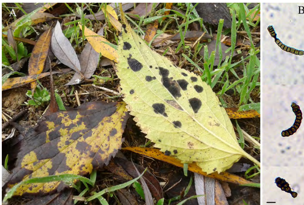
Fig. 1: Sirosporium celtidis . A) fulles de lledoner ( Celtis australis ) parasitades; a la fulla de la dreta es veuen les taques vellutades on es formen els conidis. B) conidis (escala = 10 µm).