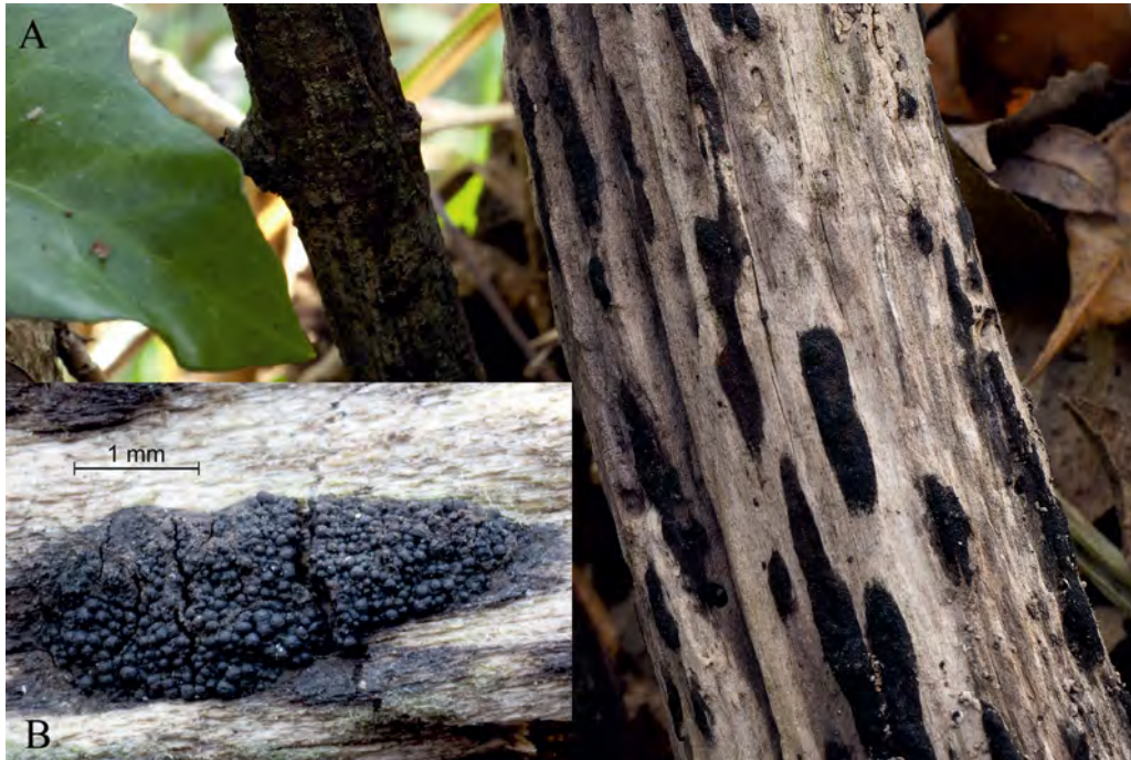
Fig. 2: Immotitia atrograna . A) fructificacions sobre una branca decorticada. B) ascomes.

GUARRO, J., L. PUNSOLA & J. CANO (1985).- Myceliophthora vellerea ( Chrysosporium asperatum ) anamorph of Ctenomyces serratus . Mycotaxon , 23: 419-427.