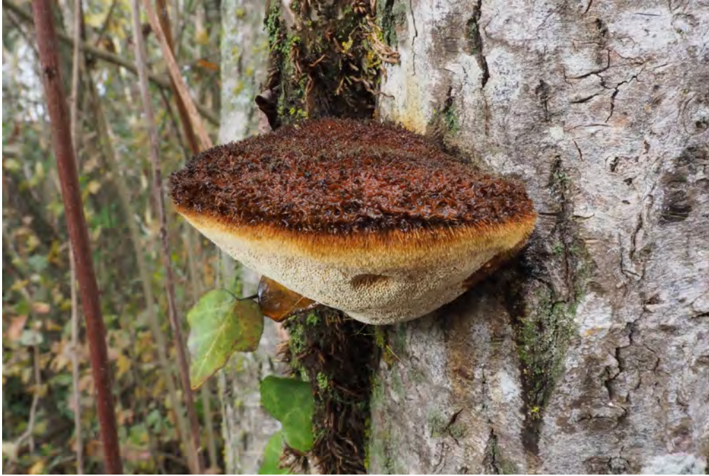
Inonotus hispidus (Bull.) P. Karst..