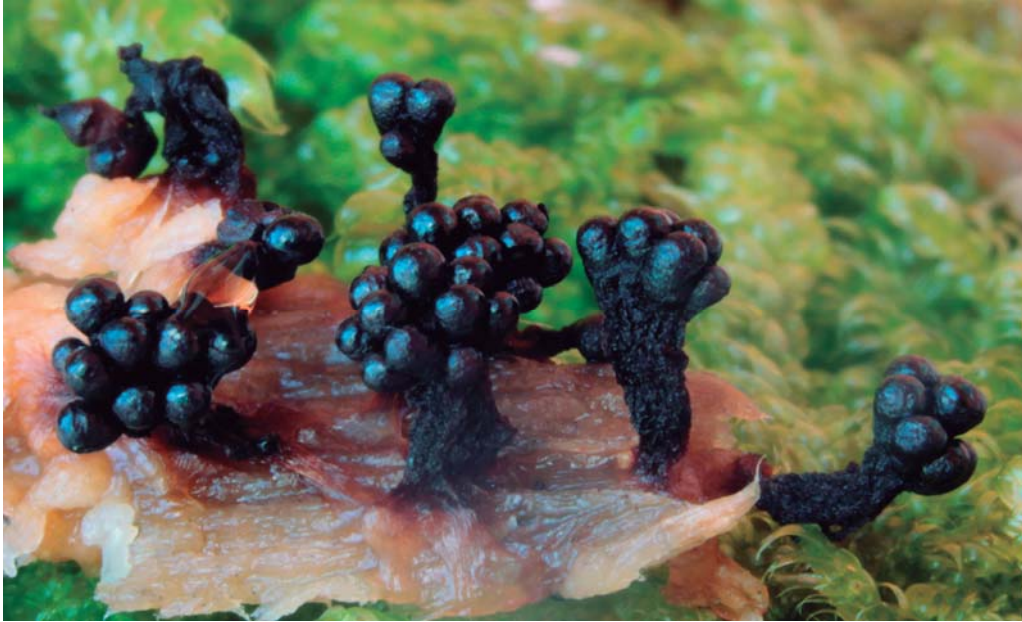
Metatrichia floriformis (Schwein.) Nann.-Bremek, esporangis