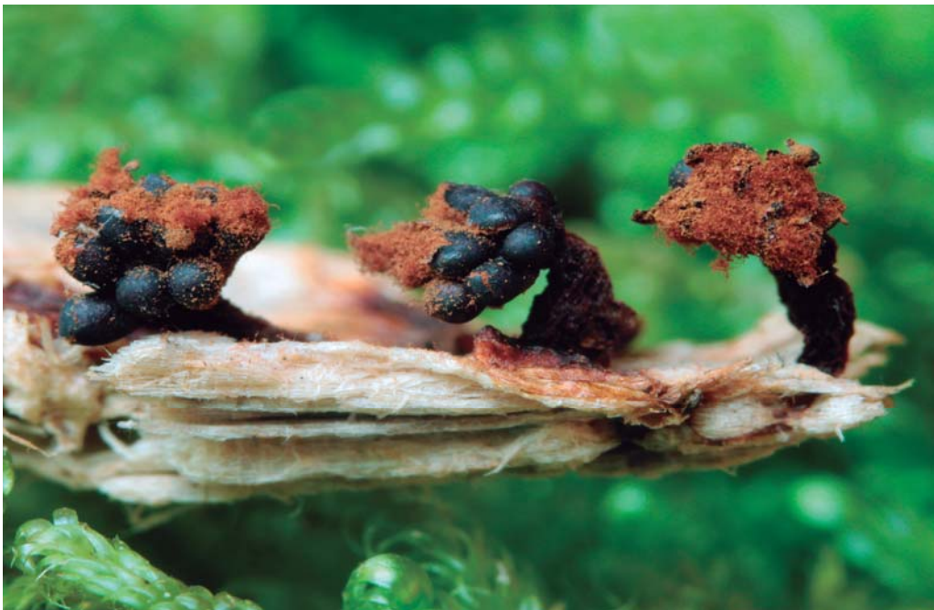
Metatrichia floriformis (Schwein.) Nann.-Bremek, esporangis esporulant